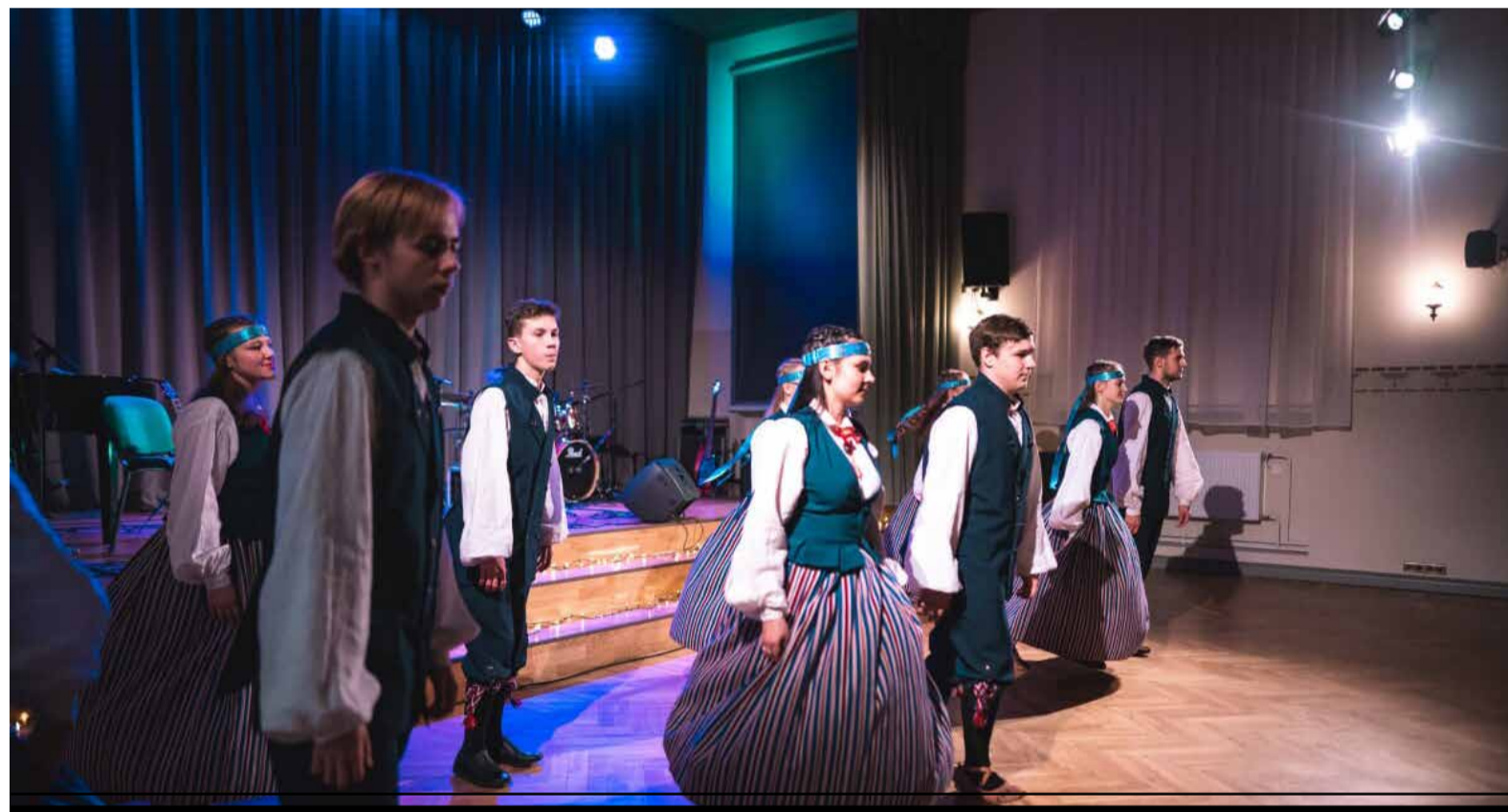
Hingele pai astus lauljate ja pillimängijate kõrval üles ka Valga Gümnaasiumi ja Valgamaa Kutseõppekeskuse segarühm Sikutajad.