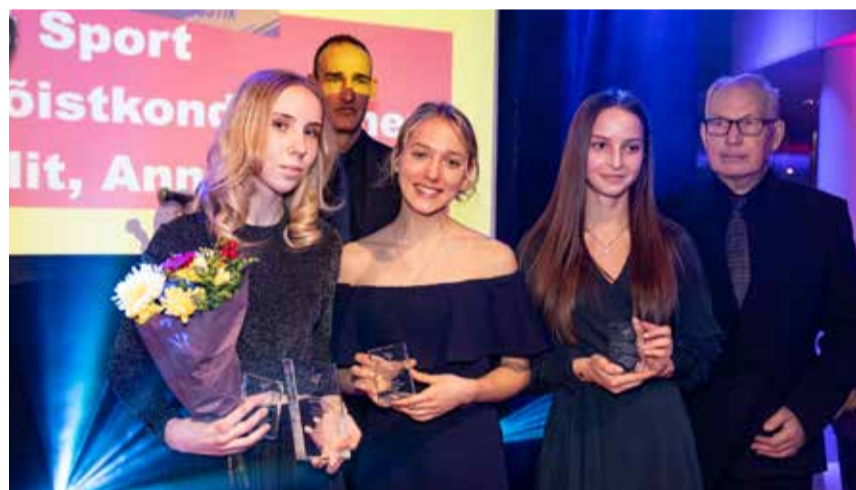
Самая успешная команда девушек - эстафетная команда до 18 лет 3x800м от Валга SK Maret-Sport.

спортивной волостью Валгамаа — волость Валга.